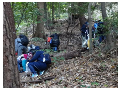
（2017年「城山の森へ行こう」）