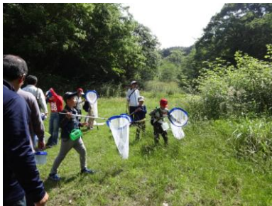
「森へ行こう！」（野外活動センター）