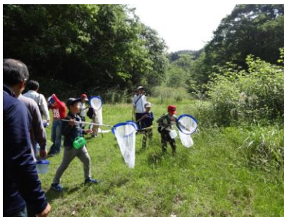
2017年5月「森へ行こう」の様子