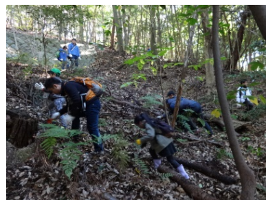
(2016年「城山の森へ行こう」の様子)