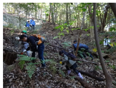
(2016年「城山の森へ行こう」の様子)